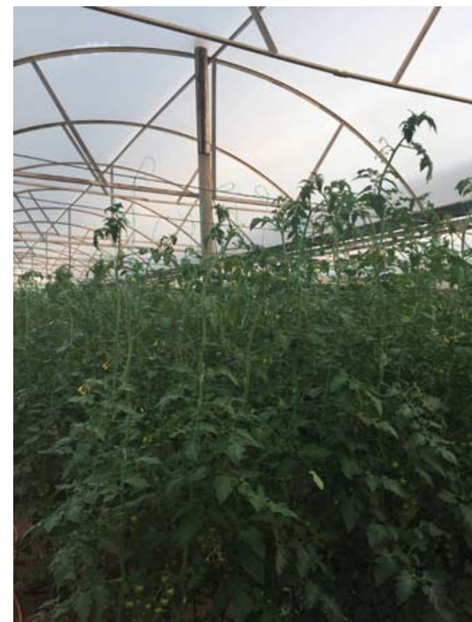
▲ Альбит ускоряет цветение и плодообразование у томатов (область Фетхие, Турция, 2016 год). Растения вверху – без обработки Альбитом, внизу – с обработкой Альбитом.

Подробнее о нашем препарате можно узнать на сайте www.albit.ru .